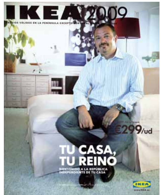
Figura 6: Calidad y calidez

→ Humanidad y emoción en la creación y entrega de valor al cliente.